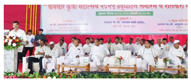
नेमलेल्या समितीचा अहवाल आठवड्यामध्ये शासनाला एप्रिल महिन्याच्या पहिल्या सादर होईल, (पान २ वर)

कोळपेवाडी : कधी दुष्काळ पडतो तर कधी गारपीट होते आणि शेतकऱ्यांचे उत्पन्न वाढलं की, बाजारभाव पडतात. शेतकरी अडचणीत आलेले आहेत. शेतकऱ्यांच्या अडचणी काय असतात याची मला जाणीव आहे. मी पण शेतकऱ्यांचाच मुलगा आहे,