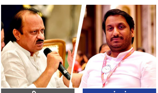
तहसीलदार, उपनिबंधक निलंबित

पुणे : उपमुख्यमंत्री अजित पवार यांचे पुत्र पार्थ पवार यांनी पुण्यातील कोरगाव पार्कमधील १८०० कोटीची ४० एकर जमीन अवघ्या ३०० कोटीमध्ये खरेदी केली. गंभीर बाब म्हणजे या व्यवहारात पार्थ पवार यांच्या अमेडिया होल्डिंग्स एलएलपी कंपनीला तब्बल २१ कोटी रुपयांची स्टॅप ड्युटी माफ करण्यात आली आहे. यासाठी मुद्रांक शुल्क केवळ ५०० रुपये भरल्याचा दावा शिवसेना ठाकरे गटाचे