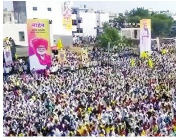
हातात घेता. तुम्हाला काय आजार तुम्ही प्रक्षोभक विधाने करता, असे झाला देवालाची माहिती. पण तेथून छगन भुजबळ म्हणाले. (पान २ वर)