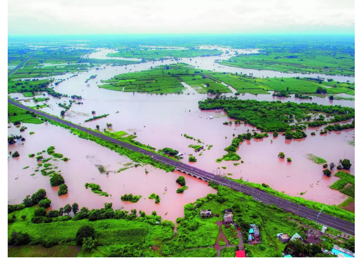
मदत 'एनडीआरएफ' मधून तर सरकार 'एसडीआरएफ' मधून देणार वाढीव एक हेक्टरची मदत राज्य आहे.

खात्यात वर्ग करण्याचे नियोजन करण्यात आले आहे. शुक्रवारी रात्री उशिरापर्यंत कृषी व मदत व पुनर्वसन विभागातील अधिकाऱ्यांचे काम सुरू होते. नजर अंदाज अहवाल आणि पंचनामे अंतिम झाल्यानंतरचे एकूण बाधित क्षेत्र, याचा अहवाल कृषी विभागाच्या अधिकाऱ्यांनी राज्य सरकारला पाठविला. आता दोन हेक्टरपर्यंतची