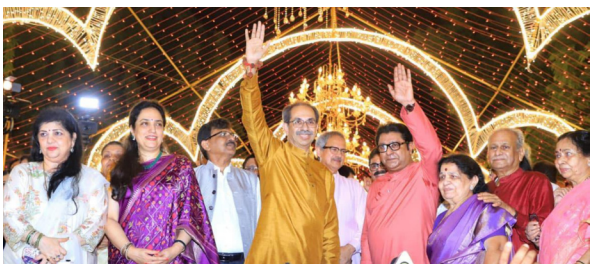
म्हणाले. यावेळी उद्भव ठाकरे यांनी महाराष्ट्रातील जनतेला दिवाळीच्या शुभेच्छा दिल्या. गेल्या दोन ते तीन महिन्यात ठाकरे बंधू सातवेळा एकत्र आले आहेत. (पान २ वर)

मुंबई : आजची दिवाळी वेगळी आहे, विशेष आहे. मला खात्री आहे की, मराठी माणसांची एकजूट आणि त्या एकजूटीचा प्रकाश सर्वांच्या आयुष्यात आनंद घेऊन आल्याशिवाय राहणार नाही. असेच सर्वजण आनंदता राहा, प्रकाश घेत राहा सर्वांना आनंद देत राहा असे उद्भव ठाकरे