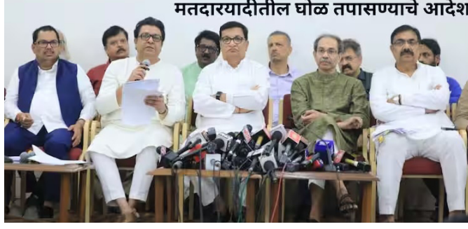
मतदारयादीतील घोळ तपासण्याचे आदेश

होतं. राज ठाकरे म्हणाले, सध्या मतदार याद्यांचा विषय महत्त्वाचा आहे. आता निवडणुका होणार का, निवडणुका होणार असतील तर कशा होणार हे महत्त्वाचं आहे. निवडणूक कोणाबरोबर होणार हा आताचा विषय नाही. २०१७ च्या पत्रकार परिषदेत मी मविआ नेत्यांबरोबर होतो. विशेष म्हणजे त्यावेळी आमच्याबरोबर या मंचावर उपमुख्यमंत्री अजित पवारही होते. आज त्यांनी देखील आमच्याबरोबर यायला हवं होतं. कारण ते त्यावेळी तावातावाने बोलत होते, मुद्दे मांडत होते.