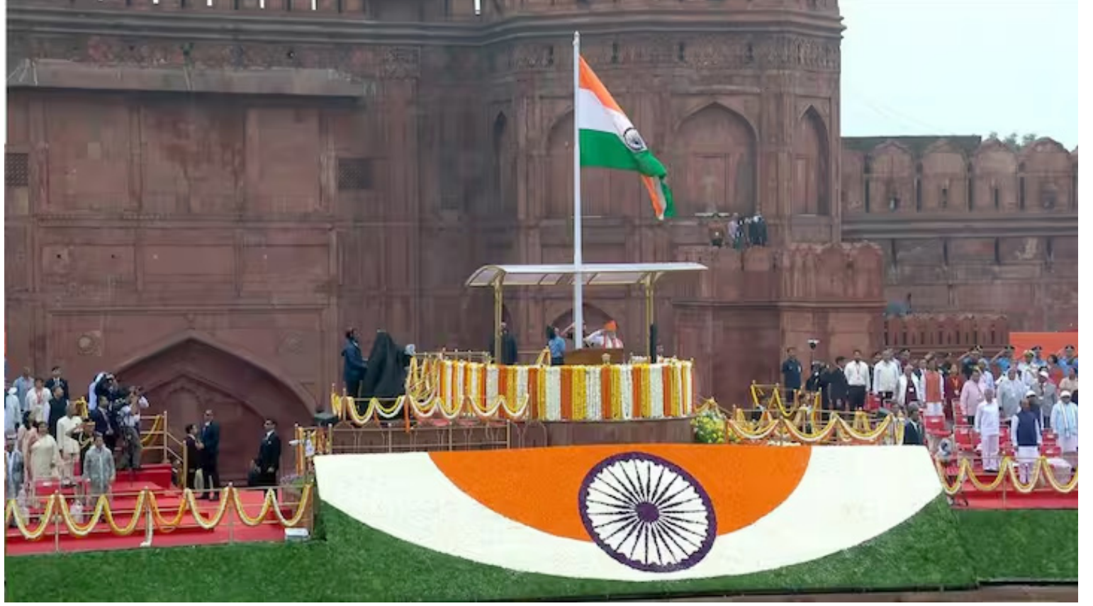
१५ ऑगस्ट रोजी पंतप्रधान नरेंद्र मोदी यांनी लाल किल्ल्याच्या तटबंदीवरून सलग १२ व्या वेळी तिरंगा फडकवला.

नवी दिल्ली : ७९ व्या स्वातंत्र्य दिनाच्या निमित्ताने पंतप्रधान नरेंद्र मोदी यांनी राजधानी दिल्लीतील लाल किल्ल्यावरून देशवासियांना संबोधित केलं. लाल किल्ल्यावर तिरंगा फडकवून पंतप्रधान मोदींनी भारतवासियांना स्वातंत्र्य दिनाच्या शुभेच्छा दिल्या. त्यानंतर संविधान निर्मात्यांना वंदन केलं. तर ऑपरेशन सिंदूरमध्ये सहभागी झालेल्या शूरवीरांनाही सलाम दिला. पहलगाममध्ये सीमेपलिकडून येणाऱ्या दहशतवाद्यांनी धर्म विचारून मारले. त्यांना